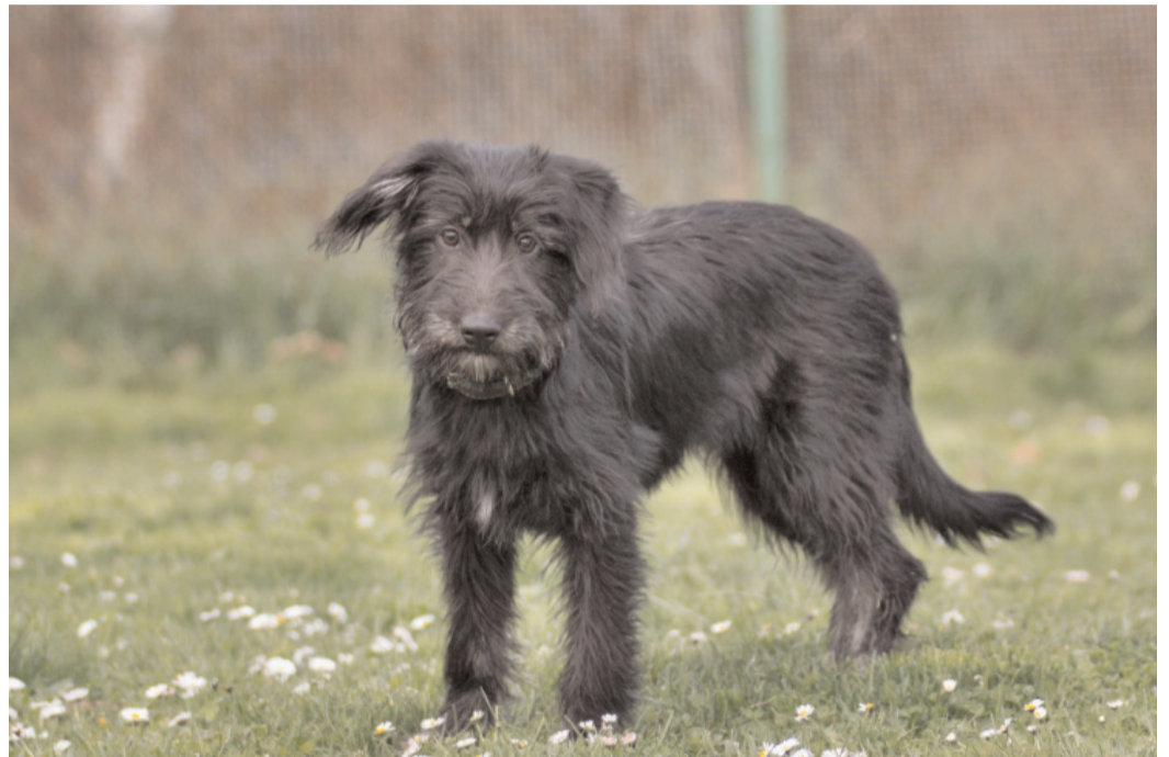
Besí, ev. č. 86: Roční fenka křížence, střední velikosti, hravá, mladá slečna. Je vhodná k domku se zahradou, může i k dětem.