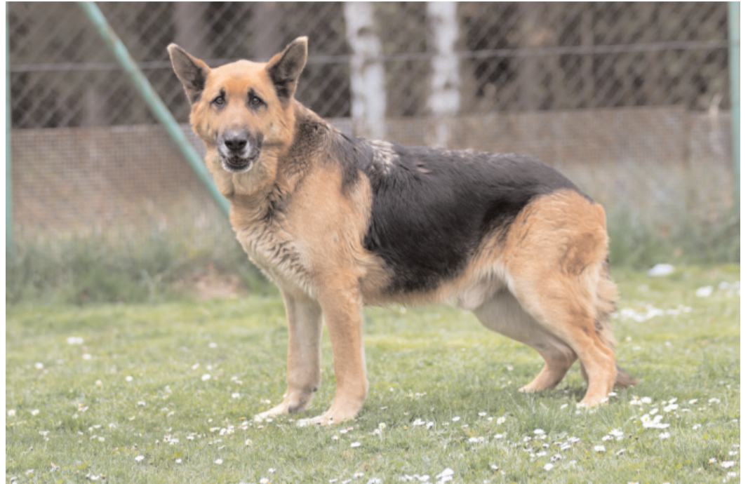
Bak, ev. č. 78: 12letý NO. Tento pejsek by si zasloužil dožít své stáří v teple domova u starších lidí. Je vděčný za každé pohlázení a bude vám věrným přítelem.