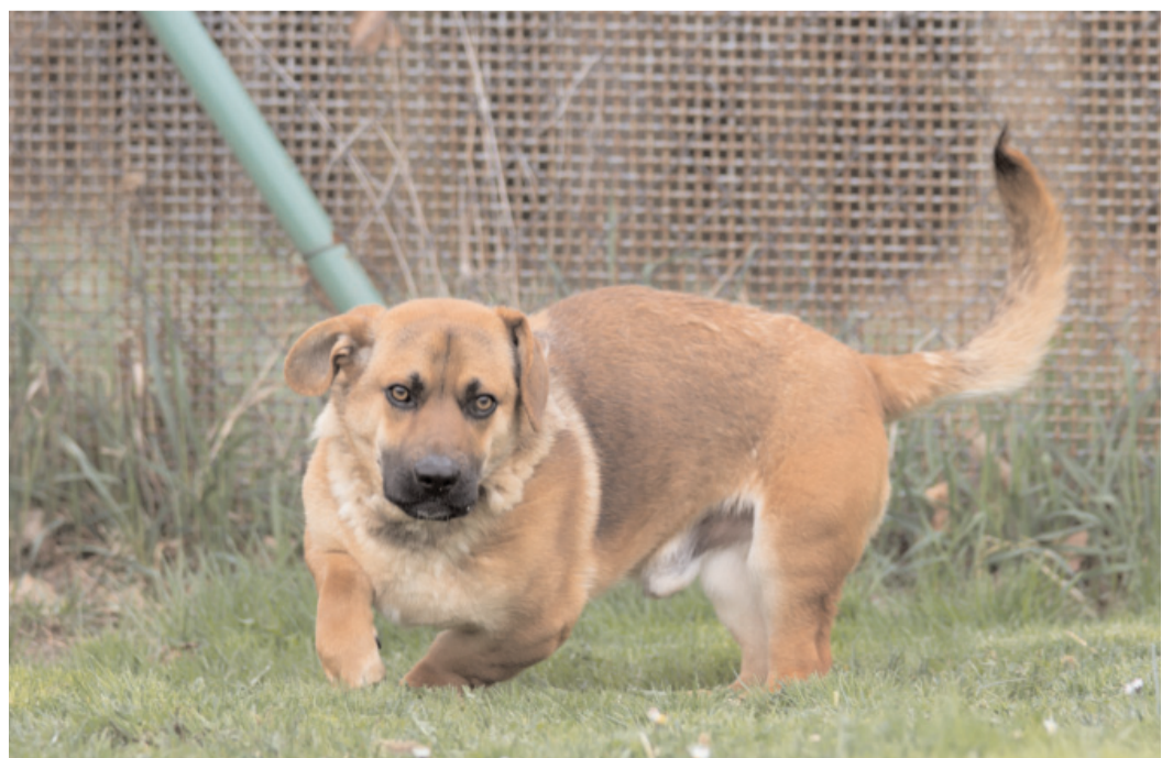
Tramp, ev. č. 10: 1,5letý kříženec baseta a NO. Vinou nesmyslného krytí je pejsek handicapovaný, a proto je vhodný pro starší a méně pohyblivé lidi. Je čistotný, se srdečným úsměvem, který každého okouzlí.