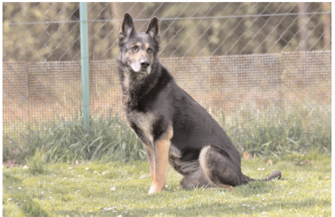
Karlík, ev. č. 85: Německý ovčák 10letý. Odchycen MP o Obory. Je to hodný, přátelský pejsek. Byl vděčný za velkou zahradu, kterou by vám profesionálně ohlídal.