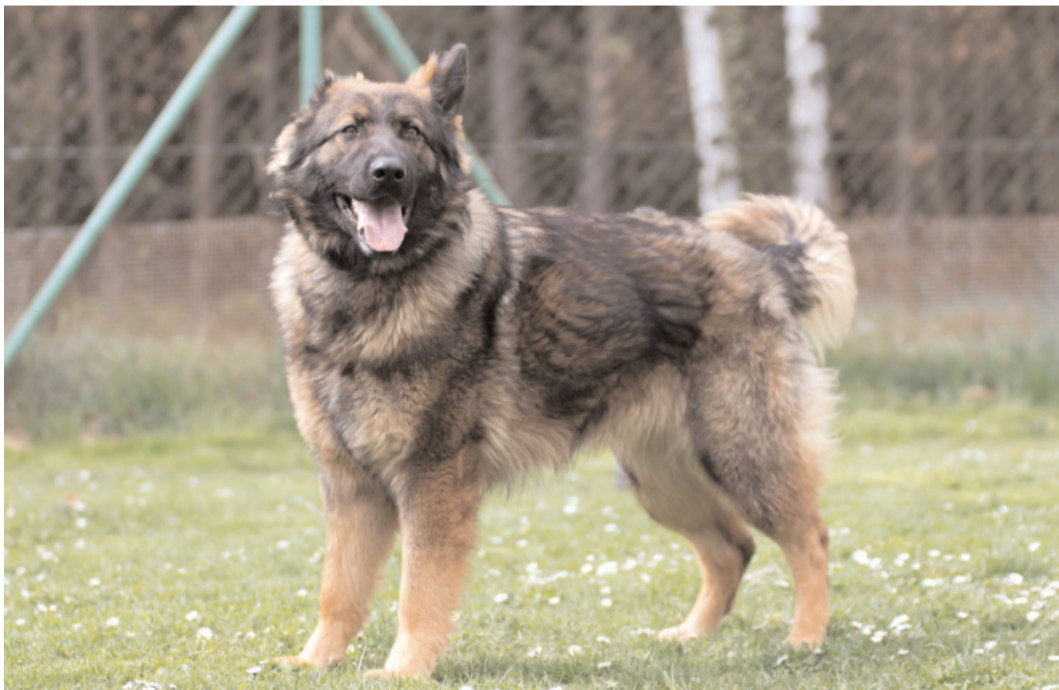
Dina, ev. č. 75: 1,5letá fena NO, živé, přátelské povahy, vhodná k výcviku pro zkušeného chovatele. Má delší srst.