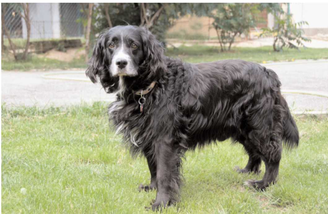
Oskar, ev. č. 15: 8-9letý kříženec kokršpaněla, čistotný, vhodný pouze do bytu. Má rád děti. Umřela mu panička a on stále čeká na nového pána, kterému by zpřijemnil třeba i stáří....Není vhodný k ostatním psům.