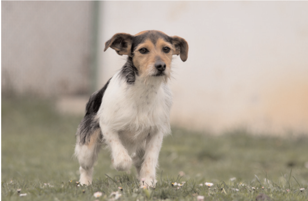
Haryk, ev. č. 66: Kříženec Jack Russel teriéra. Asi roční pejsek, přátelský. Z počátku si musíte získat jeho důvěru. Odchycen 10. 3. 2014 městskou policií na Novém rybníku.