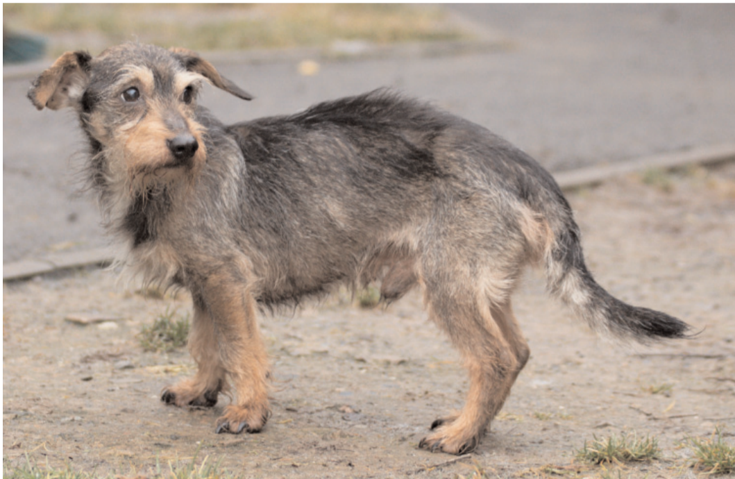
Beník, ev. č. 38: Kříženec hrubosrstého jezevčíka, asi 8letý, velice hodný. Vhodný ke starším lidem, kterým bude skvělým společníkem.